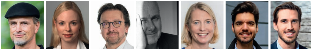
PROF. DR. JÜRGEN SCHMIDHUBER

in Zusammenarbeit mit gym | INTERLAKEN Abteilung Gstaad