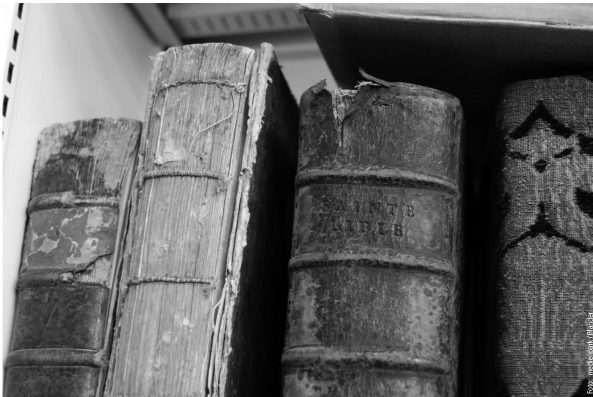
«Nicht einmal ein Bekenntnis hat die Heiligkeit der Bibel.»

techismustyp, muss nicht rezitierfähig, sondern diskussionsfähig sein, so formuliert, dass Menschen heute gern darüber sprechen.